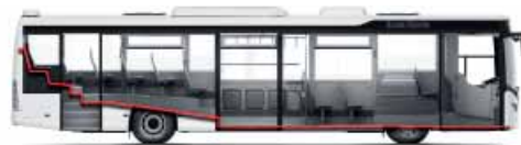
Scania Citywide LE (alacsony belépésű).